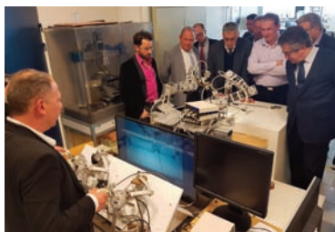
RoBioSS développe en collaboration avec le CHU un prototype pour aider à la laparoscopie.

Des groupes de médecins Libyens vont venir se former à Poitiers. Coordinée par l'ONG Acted et en association avec le Benghazi Medical Center, cette action a reçu le soutien technique du Dr Jérôme Cau, chirurgien à Poitiers. Un parcours de formation accéléré en quatre phases a été