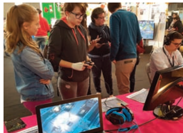
Loot me Studio a fait tester son jeu "Ironwill".

Parmi les sociétés présentes, la créatrice de jeux charentaise Ouat Enter-