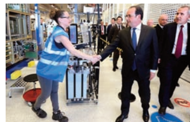
Le président a visité le site de Chauray.

une exploitation agricole, même si certaines souffrent, le Marais Poitevin, mais j'ai fait le choix d'un leader mondial. Même si dans les Deux-Sèvres, la valeur est plus à la discrétion, c'est aussi ce qui fait le charme de ce département. Cette entreprise donne à nos avions la capacité de voler. Chaque fois que je prends un avion, je sais maintenant qu'il y a un peu de Niort qui m'accompagne. Grâce à vous, nous empruntons des avions en toute sécurité et en toute confiance. Vous vérifiez, vous installez, vous n'avez pas le droit à la moindre erreur. Tous les aviateurs vous font confiance. C'est une très grande satisfaction et une fierté. » Il a également salué les efforts de recherche et développement, d'innovation, d'investissement et de formation engagés par le groupe. Au terme d'un discours volontaire, avec plu-