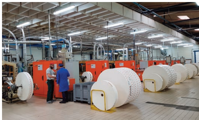
De nouvelles lignes pour la fabrication de gobelets vont être intégrées.

Après avoir embauché une centaine de personnes en début d'année, CEE Schisler, spécialisé dans les contenants papier à Thouars prévoit d'investir 11 millions d'euros en deux ans pour renouveler et moderniser l'ensemble de son parc de machines.