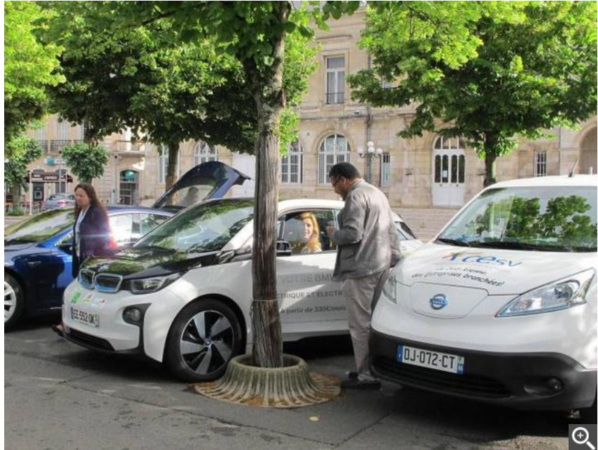
Les équipages du Tour véhicules électriques de la Vienne ont fait étape hier matin vers 9h à Chauvigny avant de repartir en direction de DéfiPlanet' à Dienné.